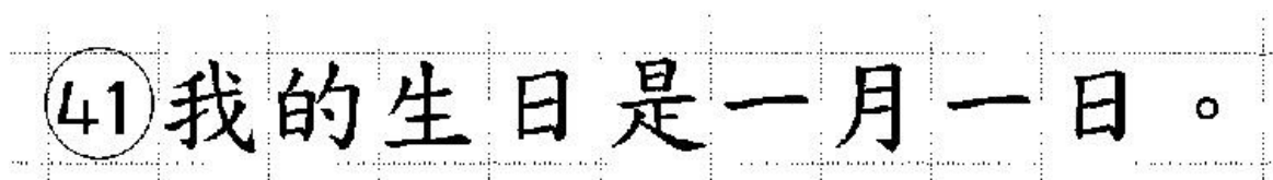
Рис. 22. Образец написания иероглифических знаков

Бланк ответов № 2 (лист 1 и лист 2) по китайскому языку (рис. 20, 21) предназначен для записи ответов на задания КИМ для проведения ЕГЭ с развернутым ответом по китайскому языку (строго в соответствии с требованиями инструкции к КИМ для проведения ЕГЭ и к отдельным заданиям КИМ для проведения ЕГЭ). Каждый иероглифический знак и каждый знак препинания следует писать внутри отдельной клетки в поле ответов бланка ответов № 2 (ДБО № 2) (рис. 24).